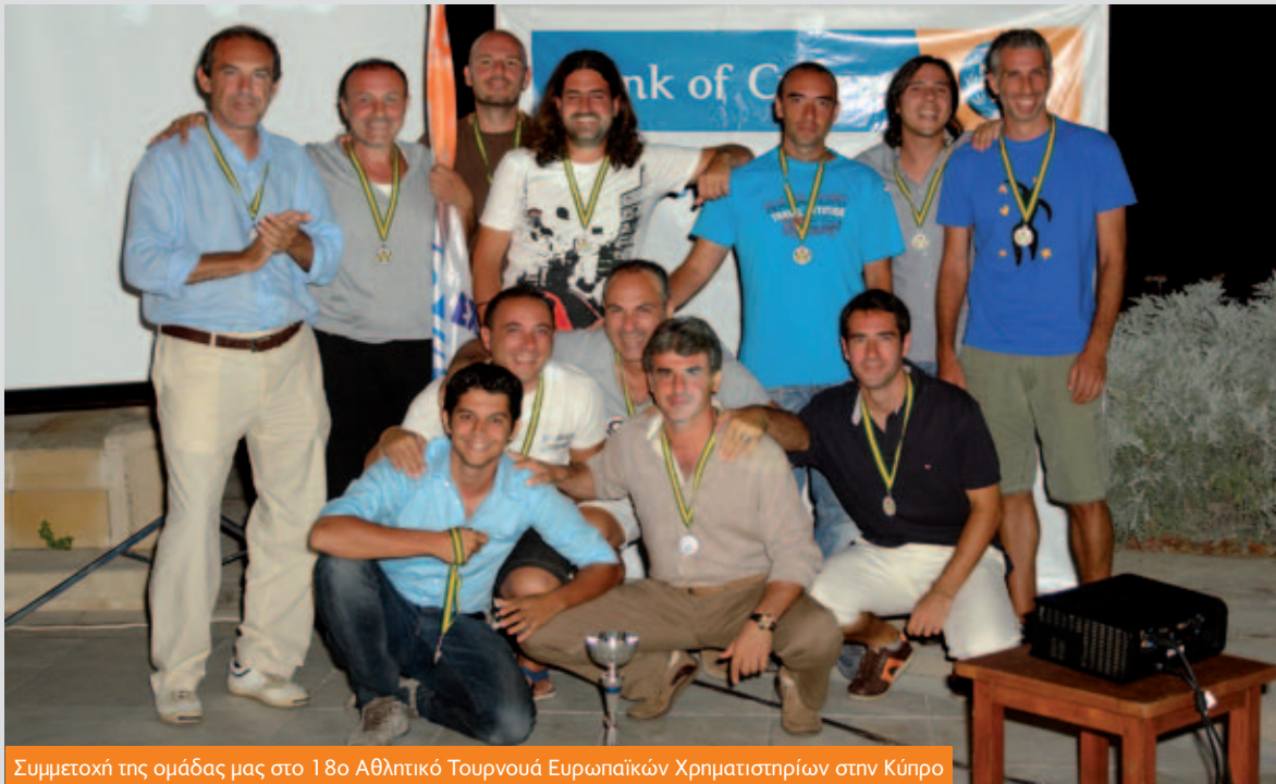
Συμμετοχή της ομάδας μας στο 18ο Αθλητικό Τουρνουά Ευρωπαϊκών Χρηματιστηρίων στην Κύπρο