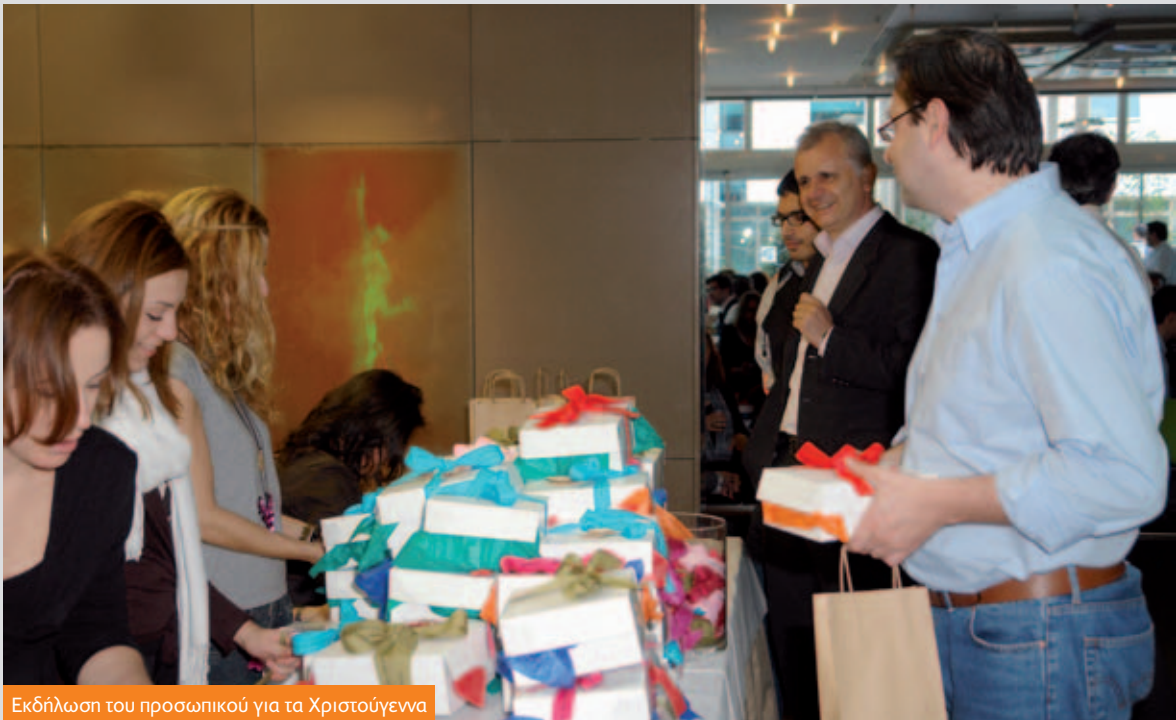
Εκδήλωση του προσωπικού για τα Χριστούγεννα