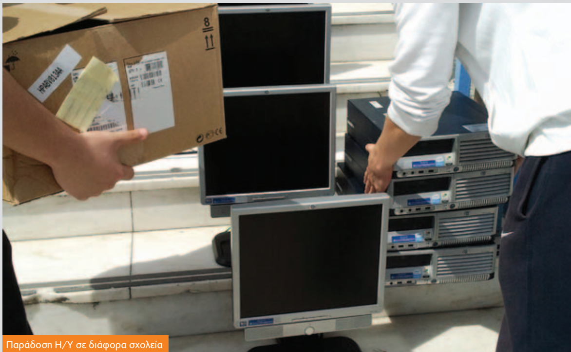
Παράδοση Η/Υ σε διάφορα σχολεία