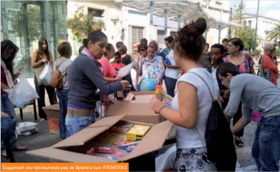
Συμμετοχή του προσωπικού μας σε δράσεις των ATENISTAS