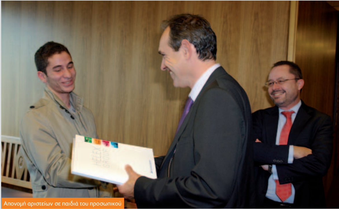
Απονομή αριστείων σε παιδιά του προσωπικού