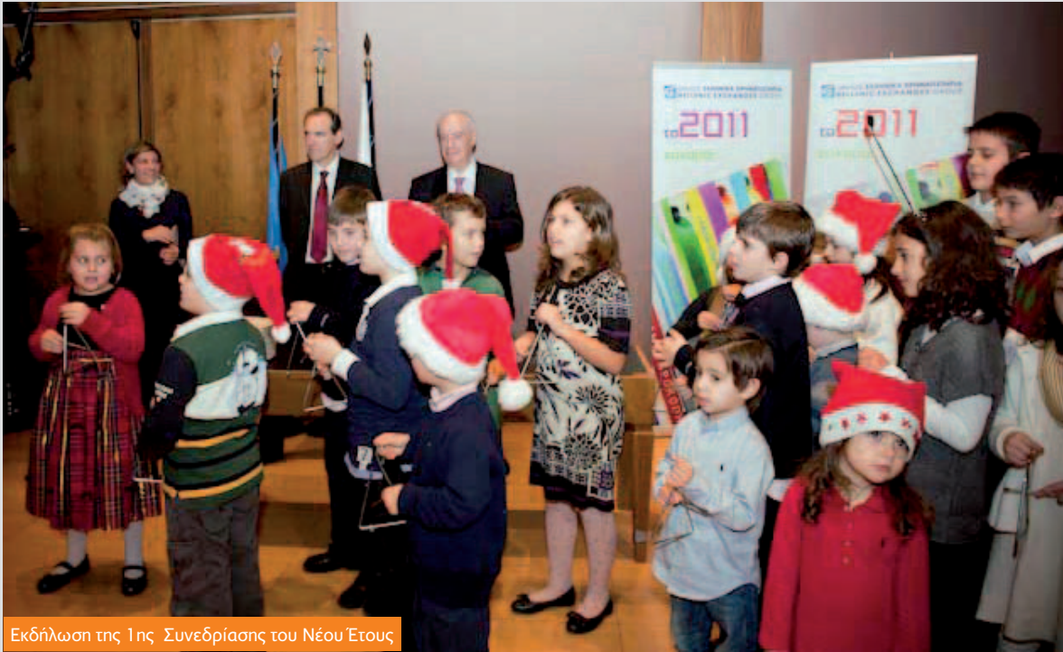
Εκδήλωση της 1ης Συνεδρίασης του Νέου Έτους