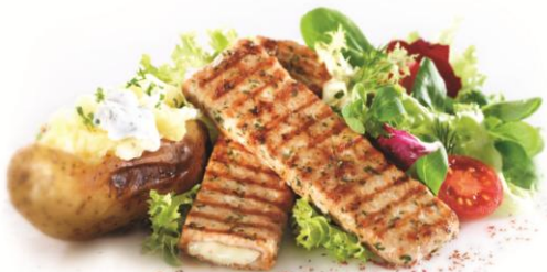
Μπιφτέκι Γεμιστό με Ήπειρος Οικογενειακό