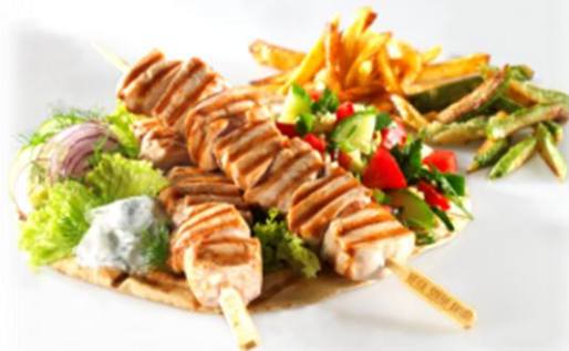
Σουβλάκι Κοτόπουλο Φιλέτο