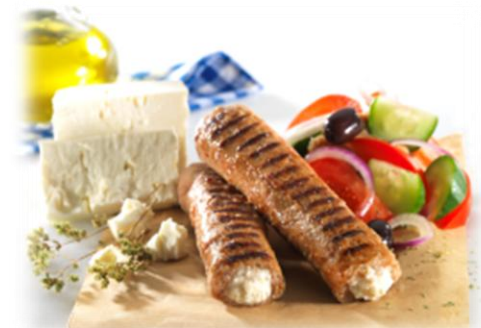
Μπιφτέκι γεμιστό με Φέτα Ήπειρος